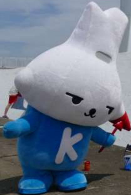
神栖市イメージキャラクター カミスココくん

『1000人画廊』は市民の皆さんの手によって描かれた壁画が並ぶ神栖市の観光スポットです。海岸線に立ち並ぶ風力発電施設と護岸壁の絵画は、その景観の美しさから映画やPVの撮影に使われるなど、注目を集めています。