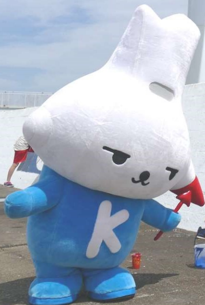
神栖市イメージキャラクター カミスココくん

『1000人画廊』は 市民の皆さんの手によって描かれた 壁画が並ぶ神栖市の観光スポットです。 海岸線に立ち並ぶ風力発電施設と護岸壁の絵画は、その景観の美しさから 映画やP Vの撮影に使われるなど、注目を集めています。